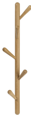
TWIGGY Perchero de pared. (17x68x11 cm; 59 €)