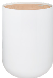
BLYTH Mesa auxiliar de bambú blanco. (40x40x53 cm; 119 €)