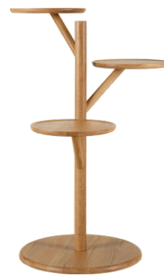
NINA Soporte auxiliar de roble. (40x90 cm; 109 €)