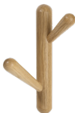
TWIGGY Perchero de pared. (15x21x9 cm; 29 €)