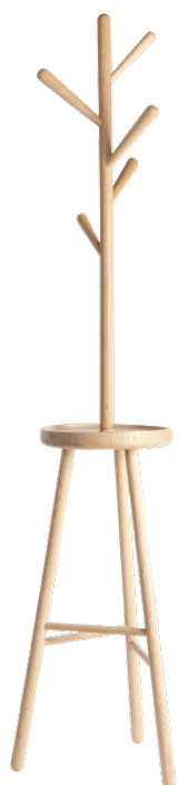
TWIGGY Perchero de pie. (170x45 cm; 180 €)

Empezamos un nuevo año y te proponemos ideas para recibirlo en tu casa. Si tienes una pared en la entrada, el perchero Twiggy puede ser una solución muy práctica y estética. Combinando diferentes tamaños de colgadores, puedes representar la forma de un árbol, empezando desde el tronco en la parte inferior y agregando las ramas hacia arriba.